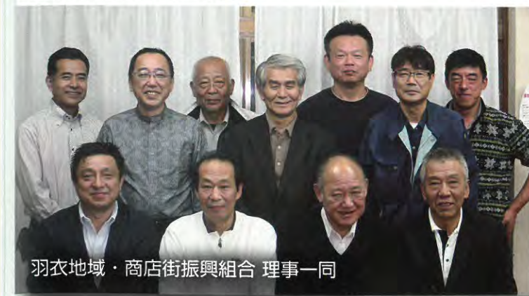
羽衣地域・商店街振興組合 理事一同