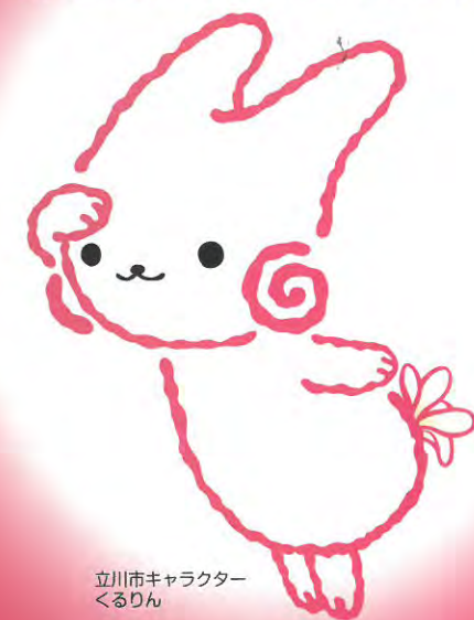
立川市キャラクター くるりん

はごろも しょうてんがい しんこう くみあい 羽衣商店街振興組合 ひがしたちかわ しょうてんがい しんこう くみあい 東立川商店街振興組合 東京都立川市羽衣町